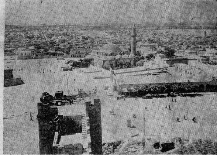
ALEPPO.—SIRIA—La foto muestra una vista de la histórica ciudad de Aleppo, uno de los más importantes centros comerciales del mediano oriente, muy conocido por su famosa ciudadela, soberbias mezquitas y su extenso tráfico de granos.